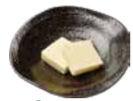
35 バター Butter 奶油