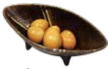
31 うずら5個 Quail's egg (5 pieces) 鸟蛋5个