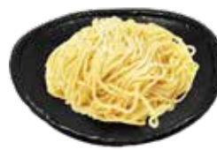
38 麺大盛 Larger serving of noodles 面大份