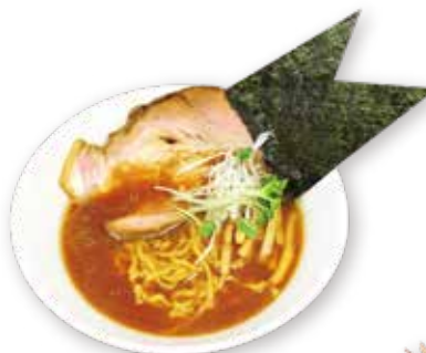
66 初代醤油らーめん Soy sauce ramen 竹藏醤油拉面 1500yen(inc.tax)