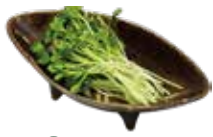
30 かいわれ Radish sprouts 萝卜苗