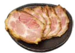
39 チャーシュー5枚 Braised pork (5 pieces) 叉烧5片