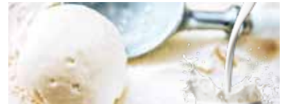
41 北海道生チョコジェラート Hokkaido raw chocolate gelato 北海道生巧克力冰激凌