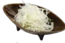
33 白髪ねぎ Green onion 白葱