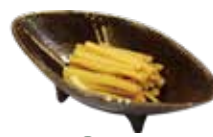
34 メンマ Bamboo Shoots 笋干