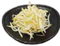
37 もやし Bean sprout 豆芽菜