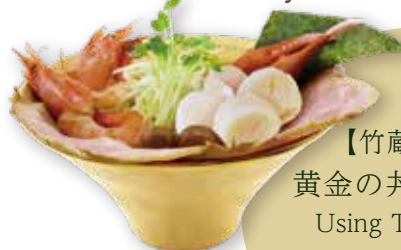
67 北海道スペシャルらーめん 味噌 miso/ 醤油 soy sauce/ 塩 salt HOKKAIDO SPECIAL ramen 北海道特制拉面 4000yen(inc.tax)

【竹藏特製】 黄金の丼ぶり使用 Using TAKEZO's original golden bowl