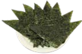
36 のり Laver seaweed 海苔