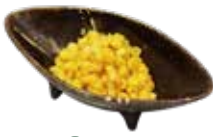
32 コーン Corn 玉米