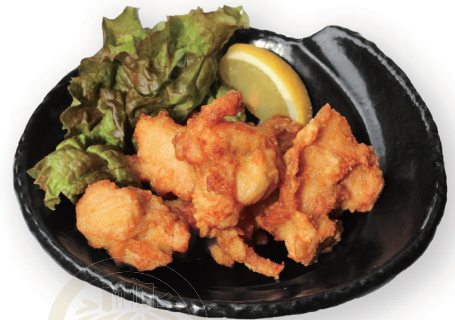
74 ざんぎ Fried Chicken 炸鸡 1000yen (inc.tax)