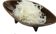
33 白髪ねぎ Green onion 白葱