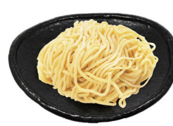
38 麺大盛 Larger serving of noodles 面大份