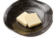
35 バター Butter 奶油