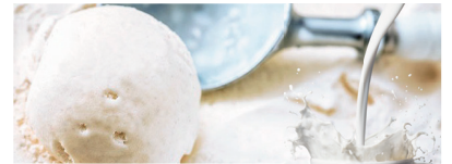
41 北海道生チョコジェラート Hokkaido raw chocolate gelato 北海道生巧克力冰激凌