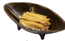
34 メンマ Bamboo Shoots 笋干