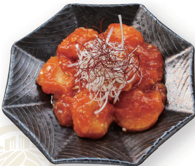
75 海老のチリソース Shrimp with Chili sauce 甜辣鮮蝦 10尾 2200yen (inc.tax)