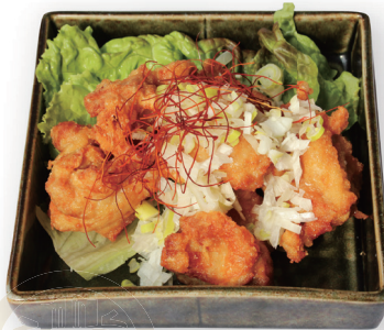
73 油淋鶏 Crispy fried chicken with fragrant sauce 油淋鶏 1200yen (inc.tax)