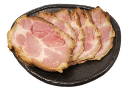
39 チャーシュー5枚 Braised pork (5 pieces) 叉烧5片