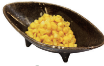
32 コーン Corn 玉米