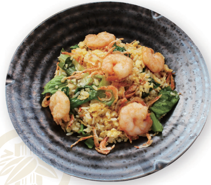
71 竹蔵海老チャーハン Fried Rice with Shrimp 鮮蝦炒飯 1600yen (inc.tax)