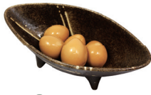
31 うずら5個 Quail's egg (5 pieces) 鸟蛋5个