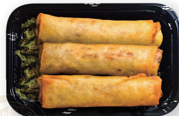
76 春巻き Egg roll 春巻 800yen (inc.tax)