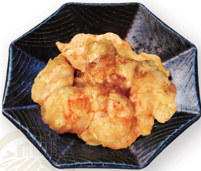
72 海老のマヨネーズあえ Shrimp with Mayonnaise 鮮蝦蛋黃醬 10尾 1800yen (inc.tax)