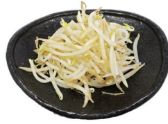
37 もやし Bean sprout 豆芽菜