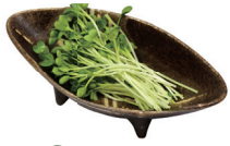
30 かいわれ Radish sprouts 萝卜苗