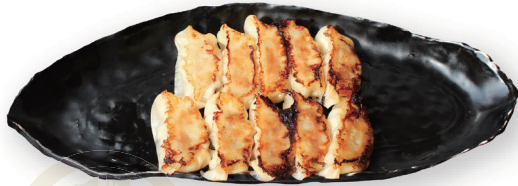
70 黒豚焼き餃子 10個 10 Japanese Pan-fried dumplings 煎餃10个 1200yen (inc.tax)