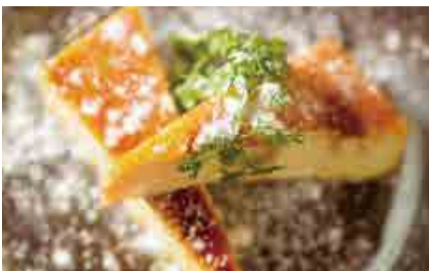
花畑牧場のカタラーナ ¥700 Crema Catalana from Hanabatake Farm 花畑牧场的焦糖奶冻