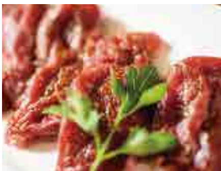
道産牛フィレ肉の 卓上ステーキ