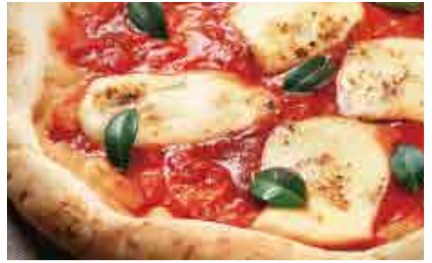
ピッツァ・マルゲリータ ¥980 Margherita Pizza / 玛格丽特披萨