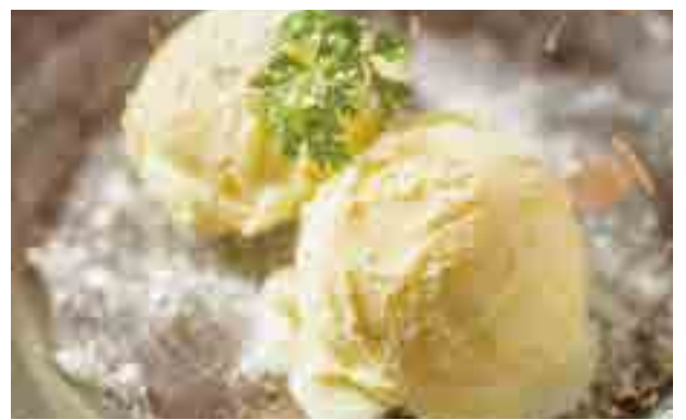
北海道ミルクアイスクリーム ¥540 Hokkaido Milk Ice Cream / 北海道牛奶冰淇淋