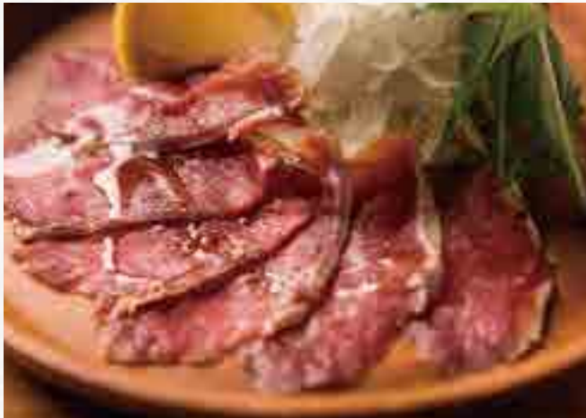
蝦夷鹿の生ハム ¥ 1,080

Ezoshikia (Hokkaido deer) venison Prosciutto 蝦夷鹿生火腿