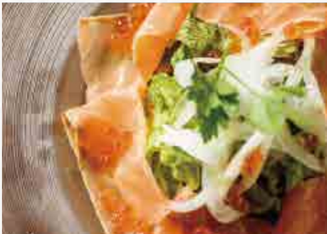
とろサーモンとイクラのカルパッチョ

Assorted Prosciutto, Venison prosciutto and Salami 生火腿, 鹿生火腿意式腊肠拼盘