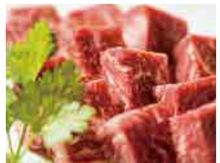
十勝和牛サーロインの 卓上ステーキ