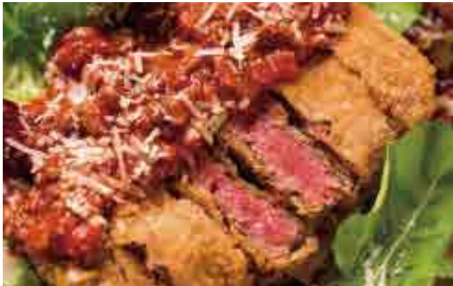
北海道牛フィレカツ ￥2,140