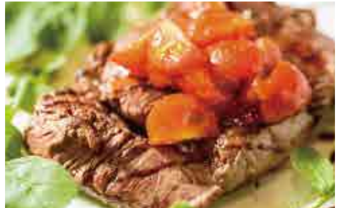
北海道牛フィレのタリアータ ￥2,140