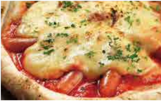
ラクレットチーズとソーセージ ¥1,280 Raclette Cheese and Sausage / 拉克雷特芝士和香肠