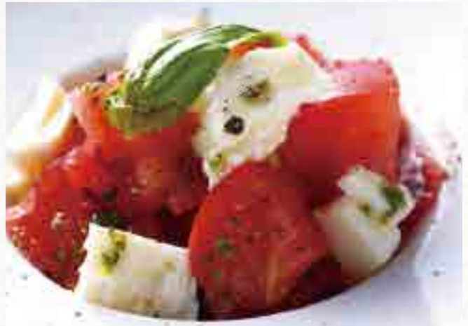
トマトと日高モッツァレラチーズの カプレーゼ

Tomato and Hidaka Mozzarella Cheese Caprese