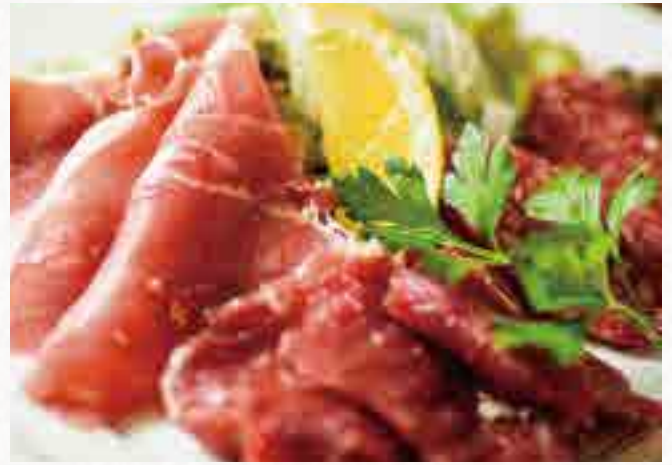
生ハムとサラミの盛り合わせ ¥ 1,980

Ezoshikia (Hokkaido deer) venison Prosciutto 蝦夷鹿生火腿