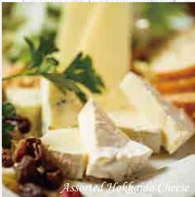
Assorted Hokkaido Cheese