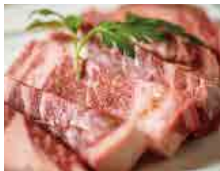
北海道標茶産【星空の黒牛】 リブロースの卓上ステーキ