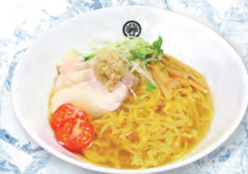
47 冷やし生姜らーめん Ginger cold ramen 姜味冷面 1100yen (inc.tax)