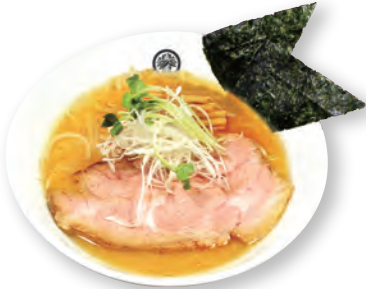
40 徳川味噌らーめん TOKUGAWA miso ramen 徳川味噌拉面 1200yen (inc.tax)