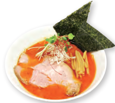
42 辛味噌らーめん Spicy miso ramen 辣味噌拉面 1200yen (inc.tax)