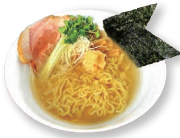
44 塩生姜らーめん Salt ginger ramen 姜汁盐味拉面 1100yen (inc.tax)