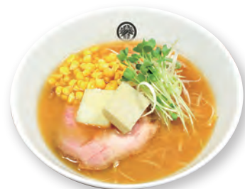
45 コーンバター味噌らーめん Corn butter miso ramen 奶油玉米味噌拉面 1300yen (inc.tax)