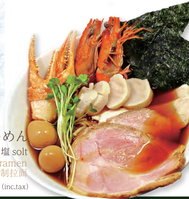
48 北海道贅尽くしらーめん 味噌 miso/ 醤油 soy sauce/ 塩 salt HOKKAIDO SPECIAL ramen 北海道特制拉面 2500yen (inc.tax)

スープが濃く感じる方には割りスープをお持ちします。お気軽にお申し付けください。汤的浓淡可以调整。请告知服务人员。 Please ask the staff, if you think the taste is too strong, we're going to add some soup to make it lightly.