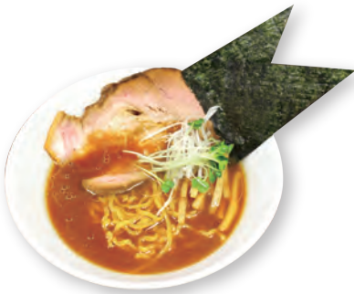
43 竹蔵醤油らーめん TAKEZO soy sauce ramen 竹蔵醤油拉面 1100yen (inc.tax)