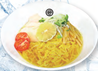
46 冷やし柚子らーめん Yuzu cold ramen 柚香冷面 1100yen (inc.tax)