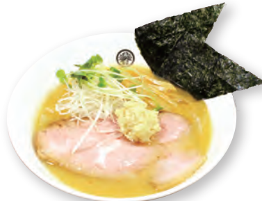
41 竹蔵味噌らーめん TAKEZO miso ramen 竹蔵味噌拉面 1200yen (inc.tax)