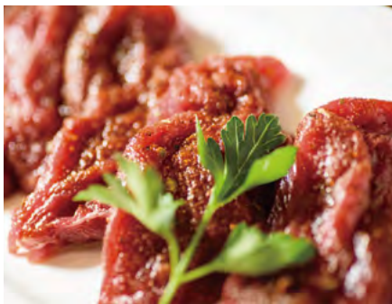
道産牛フィレ肉の 卓上ステーキ