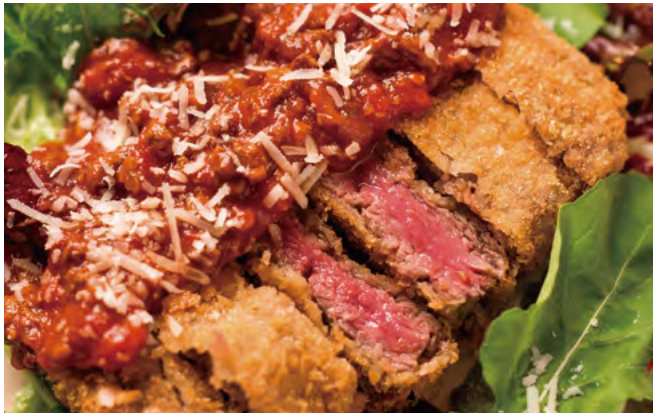
北海道牛フィレカツ ￥2,140