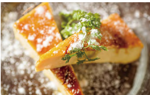
花畑牧場のカタラーナ ¥700 Crema Catalana from Hanabatake Farm 花畑牧场的焦糖奶冻