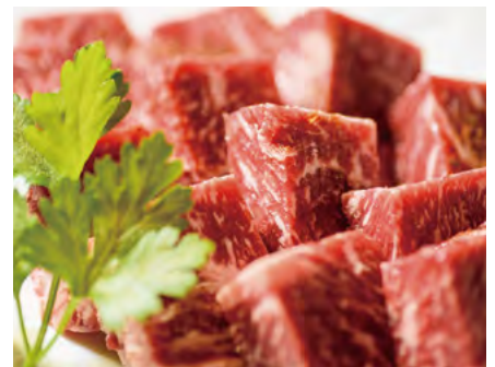
十勝和牛サーロインの 卓上ステーキ