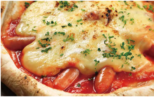
ラクレットチーズとソーセージ ¥1,280 Raclette Cheese and Sausage / 拉克雷特芝士和香肠