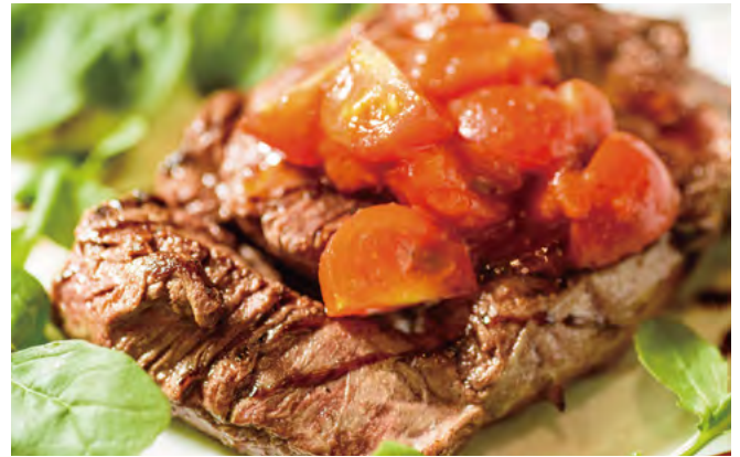
北海道牛フィレのタリアータ ￥2,140