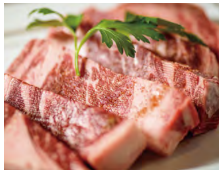
北海道標茶産【星空の黒牛】 リブロースの卓上ステーキ