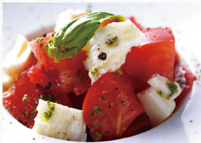
トマトと日高モッツァレラチーズの カプレーゼ

Tomato and Hidaka Mozzarella Cheese Caprese