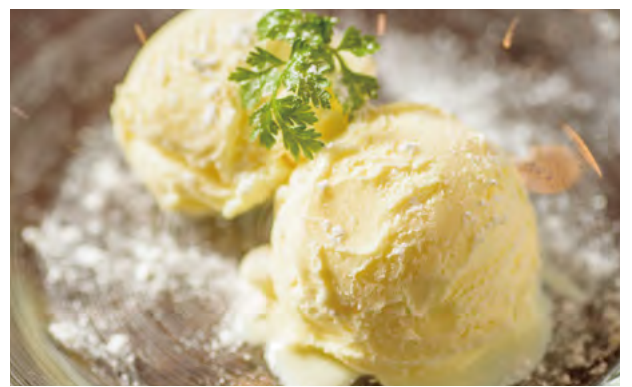
北海道ミルクアイスクリーム ¥540 Hokkaido Milk Ice Cream / 北海道牛奶冰淇淋