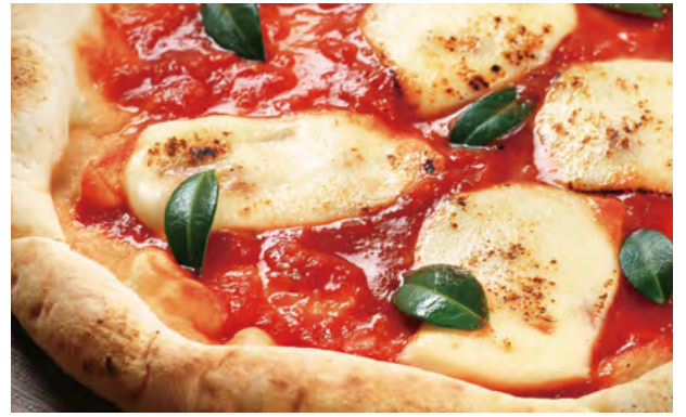
ピッツァ・マルゲリータ ¥980 Margherita Pizza / 玛格丽特披萨