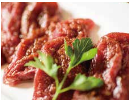
道産牛フィレ肉の 卓上ステーキ