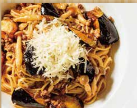
十勝産和牛ひき肉と茄子・きのこの ボロネーゼ

Tokachi Wagyu Minced Beef Bolognese with Eggplant and Mushroom 茄子蘑菇十胜产和牛肉末茄汁意面