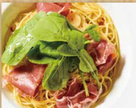
プロシュート(生ハム)とルッコラの ペペロンチーニ

Prosciutto and Arugula Pepperoncini 生火腿芝麻菜香辣意大利面