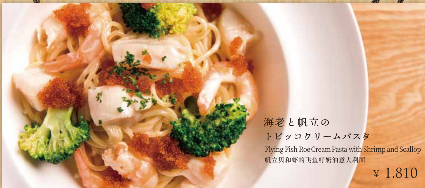
海老と帆立の トビッコクリームパスタ

Flying Fish Roe Cream Pasta with Shrimp and Scallop 帆立貝和虾的飞鱼籽奶油意大利面