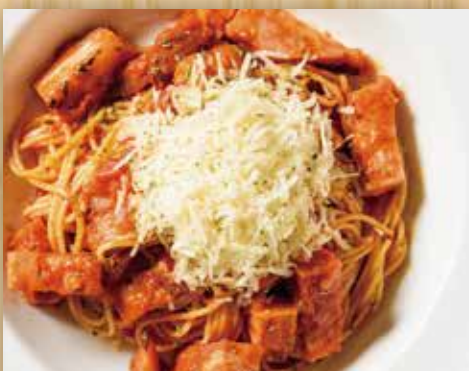
十勝ホエー豚ベーコンと エキストラチーズのアマトリチャーナ

Tokachi Whey Pork Bacon with Extra Cheese Amatriciana Sauce 芝士阿马特里奇亚纳酱十胜乳清猪肉培根意大利面