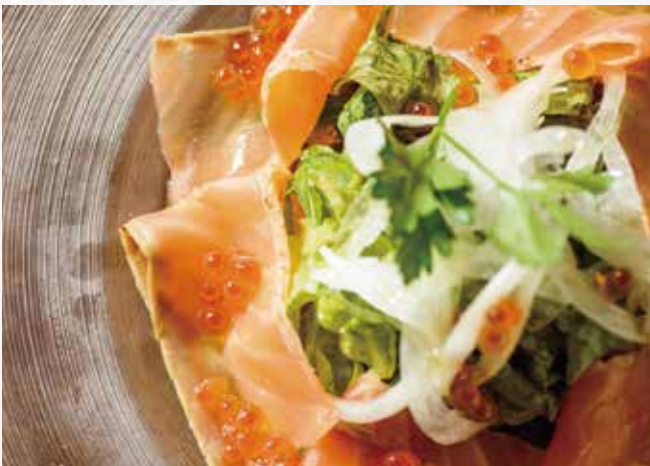
十勝産サラミソーセージ ¥ 980 Tokachi Salami Sausage 十胜产意式腊肠