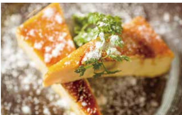
花畑牧場のカタラーナ ¥710 Crema Catalana from Hanabatake Farm 花畑牧场的焦糖奶冻