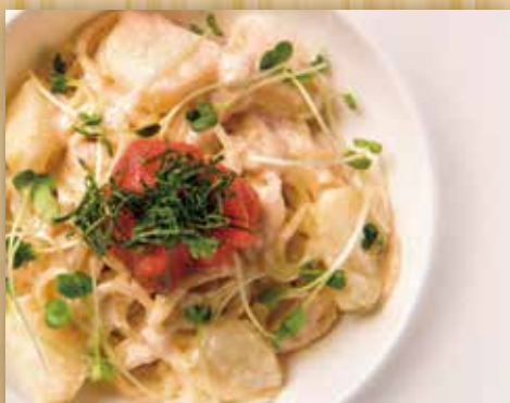
北海道産じゃが芋たっぷりの タラコクリームパスタ

Cod Roe Cream Pasta with Lots of Hokkaido Potato 北海道産土豆鱈鱼籽奶油意大利面