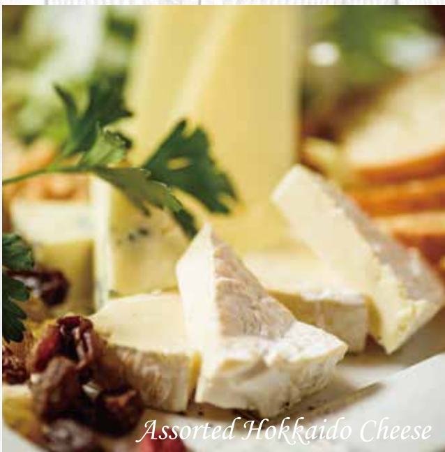
Assorted Hokkaido Cheese