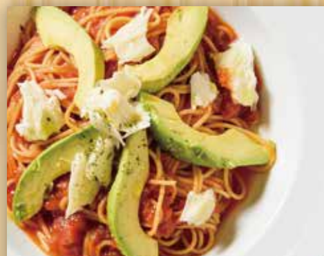
アボガドと日高モッツアレラチーズの ポモドーロ

Avocado and Hidaka Mozzarella Cheese Pomodoro 牛油果日高马苏里拉芝士茄汁意面