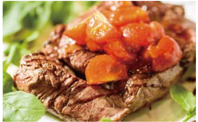
北海道牛フィレのタリアータ ¥ 2,180