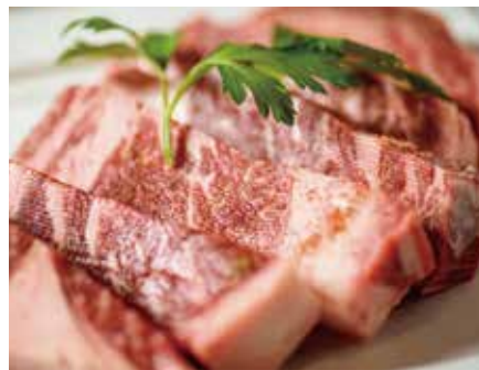
北海道標茶産【星空の黒牛】 リブロースの卓上ステーキ