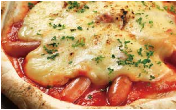
ラクレットチーズとソーセージ ¥1,380 Raclette Cheese and Sausage / 拉克雷特芝士和香肠