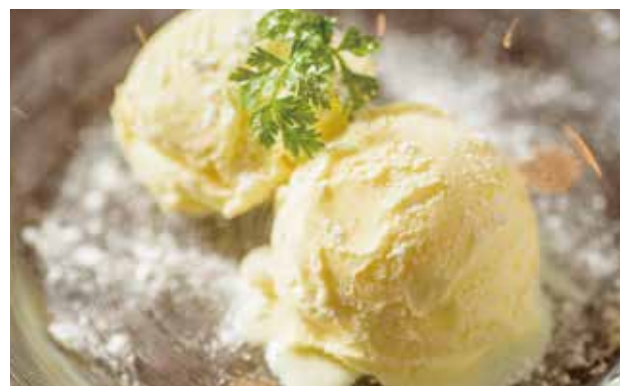
北海道ミルクアイスクリーム ¥550 Hokkaido Milk Ice Cream / 北海道牛奶冰淇淋