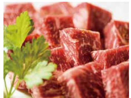
十勝和牛サーロインの 卓上ステーキ