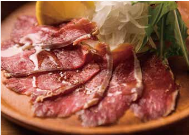
蝦夷鹿の生ハム ¥ 1,120 Ezoshikia (Hokkaido deer) venison Prosciutto 虾夷鹿生火腿