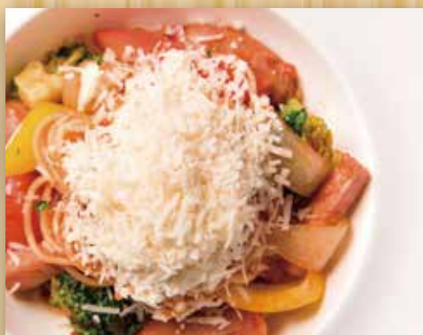
十勝ホエー豚ソーセージと ベーコンのナポリタン

Tokachi Whey Pork Sausage and Bacon Napolitan 十胜乳清猪肉香肠培根茄汁意大利面