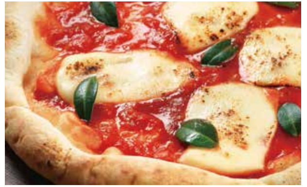
ピッツァ・マルゲリータ ¥1,180 Margherita Pizza / 玛格丽特披萨