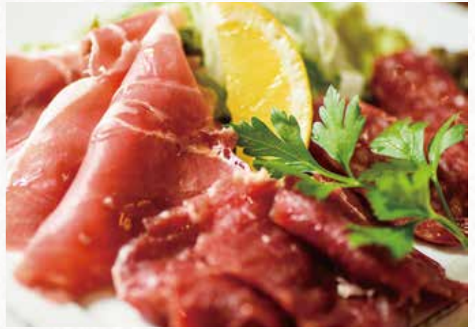
生ハムとサラミの盛り合わせ ¥ 2,100 Assorted Prosciutto, Venison prosciutto and Salami 生火腿, 鹿生火腿意式腊肠拼盘