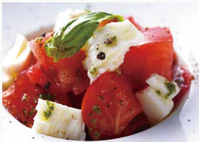
トマトと日高モッツァレラチーズの カプレーゼ

Tomato and Hidaka Mozzarella Cheese Caprese 日高马苏里拉奶酪番茄沙拉