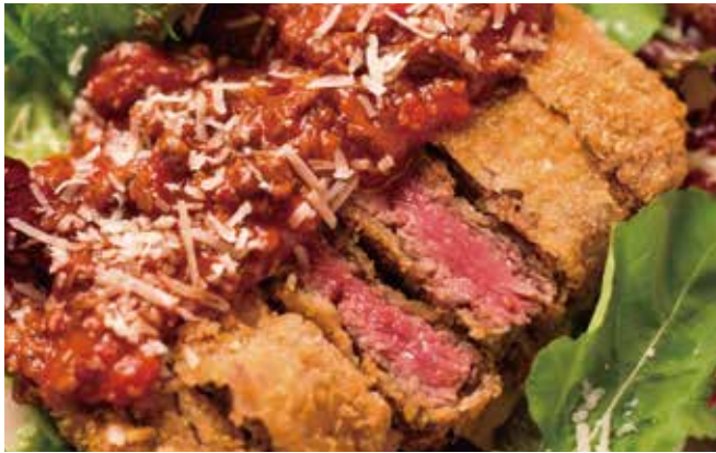
北海道牛フィレカツ ¥ 2,180